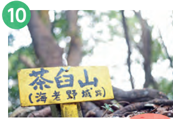
10 茶白山 408m

山頂は、戦国時代の山城跡。後入道登山口からこもれば深谷口を経て、香春町と北九州市を分ける境界尾根を東へたどる。目立たないピークだが、自然林に包まれた登山道にはいぶし銀の趣があり、気持ちよく歩ける。秋には紅葉も楽しめる。展望台からの景色は圧巻。