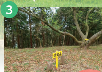
3 愛宕山 488m

呉ダム深流公園から九州自然歩道を兼ねる登山道をたどって山頂へ。登山道、道標ともによく整備されており、安心して歩ける。公園ふらの山頂は居心地がよく、そこから西へ下った薬師ノ頭へ足を延ばせば、胸のすく展望が得られる。