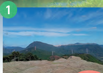
1 障子ヶ岳 427m

筑豊のシンボル「香春岳」は五木寛之の「青春の門・筑豊編」で有名な山で、一ノ岳は石灰の採掘で半分程の高さになりましたが、香春町の名前の由来にもなった山。香春町にはその他にも300m～760m程度の素晴らしい低山があります。この低山を10座登るスタンプラリーにスマホを使ってチャレンジしましょう！10山のスタンプをコンプリートすると素敵なオリジナルグッズが貰えます。