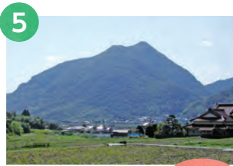
5 三ノ岳 / 香春岳 508m

道の駅香春にある万葉公園が登山口。歩き始めはやや急登だが、尾根に乗れば緩やかになる。山頂まで約50分。後醍醐天皇の皇子、懐良親王ゆかりの里山である。登山道は明瞭で、懐良台、鶴が峠といったランドマークもあり、安心して歩ける。