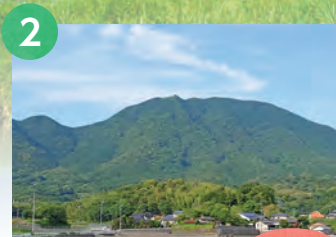
2 大坂山 573m

戦国時代に山城が築かれていた山。本丸跡、二ノ丸跡、北ノ丸跡などがくっきりと残り、往時の様子を偲ぶことのできる点に特色がある。味見峠からの登山道は明瞭で、迷うところはない。草木間わず花も多く、ハイキングを楽しむのにぴったりである。