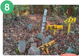
8 金満山 526m

福智山系の稜線上にある標高点ピーク。後入道登山口から境界尾根、稜線、鮎返新道をたどって周回可能。きついアップダウンはあるが、草付きの山頂に立てば、素晴らしい展望できつさも吹き飛ばす。自然林も多く、山登りの醍醐味を堪能できる。