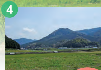
4 小富士山 337m

湯山第一登山口からのルートにはヤマザクラの巨木が点在する。途中の森は照葉樹林が美しく、森林浴気分が歩ける。登山道は硬く踏まれており、初めてでも安心して歩ける。頭上の開けた山頂は開放感があり、のんびりくつろげる。